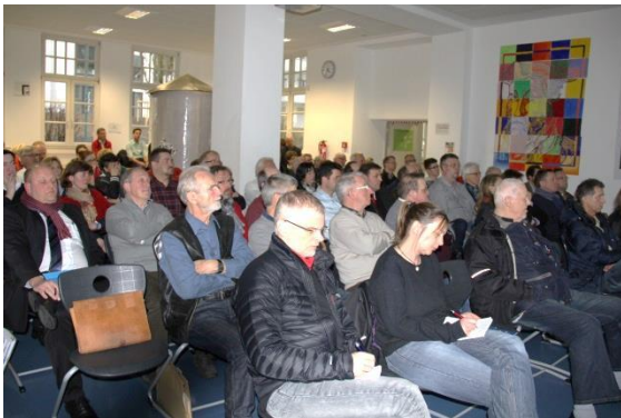
Blick ins Plenum der Stadtkonferenz

Die Veranstaltung fand an zwei Tagen in identischer Form statt, um mehr Bürgern die Teilnahme zu ermöglichen. Seit der ersten Stadtkonferenz im Juni des vergangenen Jahres ist viel passiert und die Pläne sind konkreter geworden. Bezüglich der Themen „Parken“ und „Verkehr“ wurden konzeptionelle Überlegungen angestellt, diskutiert und die ersten Maßnahmen bereits umgesetzt.