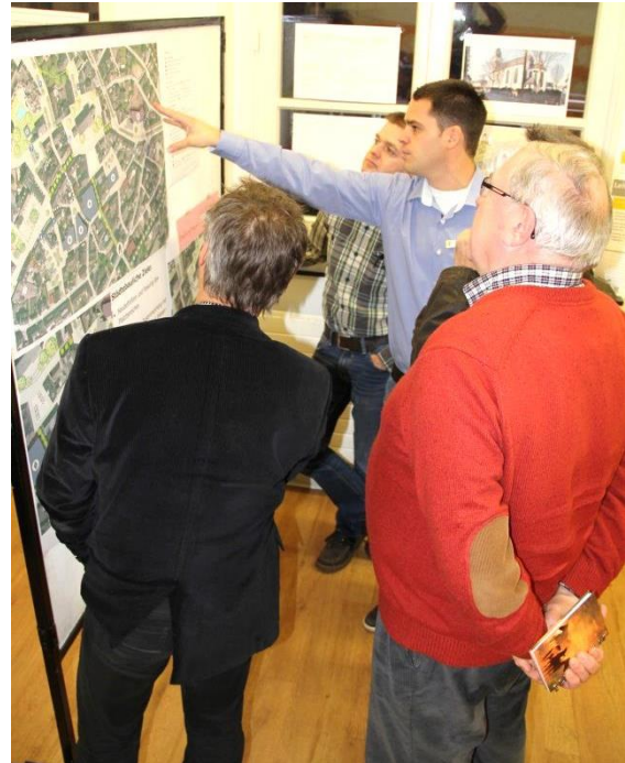
Angeregte Diskussionen

Das Fachbüro für Städtebau „Planungsgruppe MWM“ aus Aachen hat seine umfangreiche räumliche Analyse, sowie die Mängel- und Chancen-Analyse der Innenstadt abgeschlossen und die zahlreichen Vorschläge und Anregungen der Attendorner Bürger aufgearbeitet.