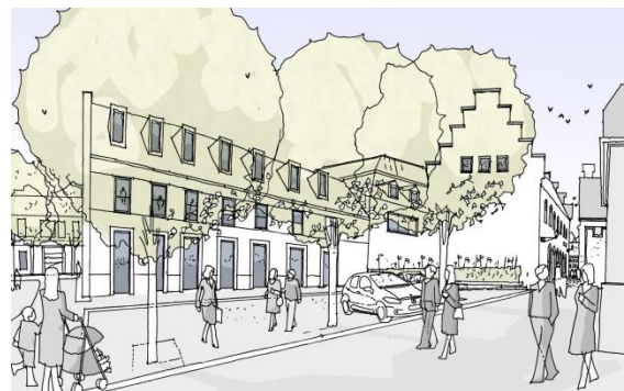
Mögliche Umgestaltung Quartier Tangel

das Ziel, Markt- und Kirchplatz zu verbinden. In der Bicketurmstraße und am Feuerteich soll „das grüne Altstadtquartier“ mit ausreichend Parkraum am Feuerteich entstehen. Der Altstadteingang Nord soll als vielseitige Einkaufsstraße punkten und der Altstadteingang Ost durch Trittsteine zur Verbindungsachse zwischen Fußgängerzone und Alleecenter werden.