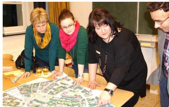
Workshop- Phase