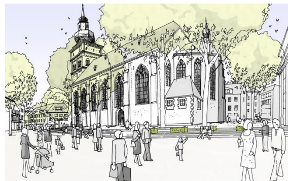
Mögliche Umgestaltung Kirchplatz

Das Ziel der Gestaltung des östlichen Innenstadteingangs ist eine Steigerung der „Ankommenskultur für die Innenstadt“ durch eine Aufwertung des Bahnhofsgeländes. Die Innenstadt Ost soll im Freizeit- und Erholungswert weiter gesteigert werden und die historischen Wälle das „grüne Rückgrat der Altstadt“ durch eine Aufwertung und naturnähere Gestaltung werden.