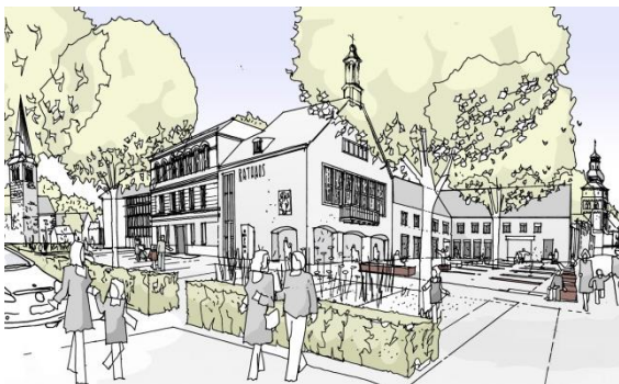
Mögliche Umgestaltung Kloster-/ Rathausplatz

Nachdem Bernd Niedermeier von der Planungsgruppe MWM nochmal kurz auf die vier Handlungsfelder Verkehr und (Nah-)Mobilität, Wirtschaftsstandort Innenstadt, Städtebau, Stadtbild und Freiraumqualität sowie Wohnen und Leben einging, stellte er die Ziele und Entwürfe des geplanten Innenstadtkonzeptes vor. Aufgegliedert wurde es in die zwölf Handlungsräume, welche sich vom westlichen Innenstadteingang am Kölner Tor über die historischen Wälle bis hin zur Innenstadt Ost vom Alleecenter bis zur Atta-Höhle erstrecken. Der westliche Innenstadteingang soll durch verschiedene Maßnahmen ein anderes Erscheinungsbild erhalten. Für den Altstadteingang West im Bereich Kloster und Rathausplatz ist Begrünung zur Steigerung der Aufenthaltsqualität geplant.